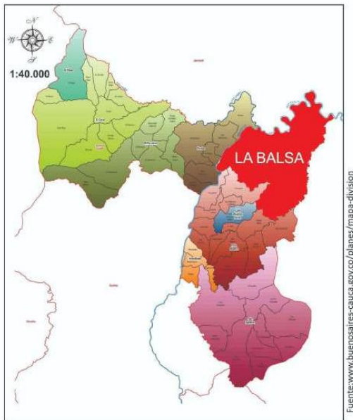
Ilustración 2. Mapa Localización Corregimiento La Balsa Municipio de Buenos Aires Cauca