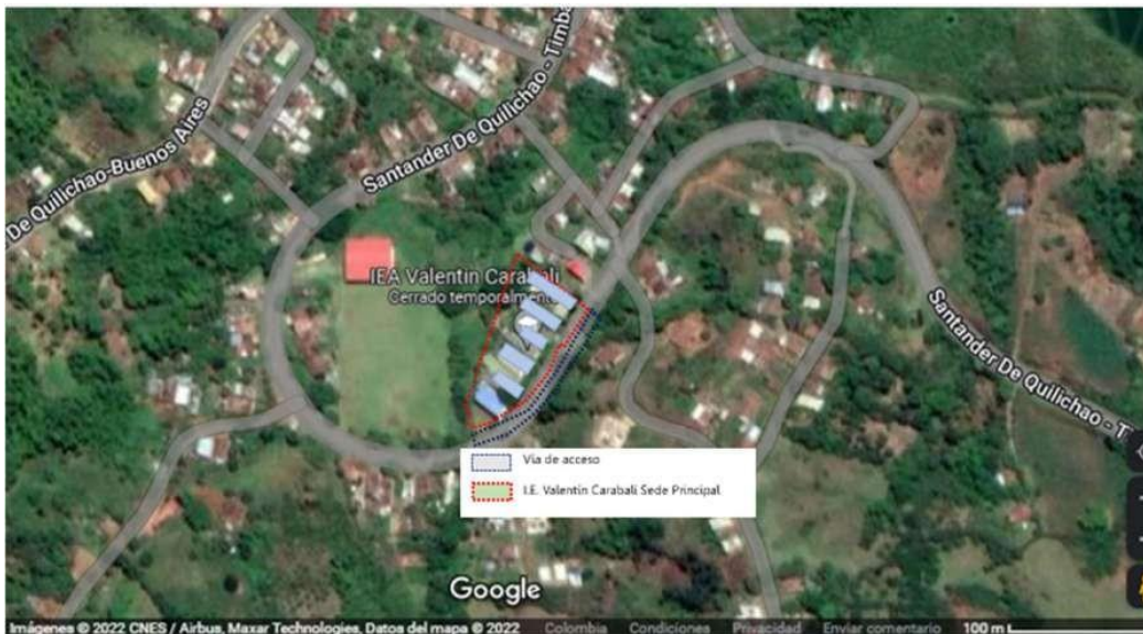
Ilustración 3. Ubicación Sede principal de la Institución Educativa Agroindustrial Valentín Carabalí.

La Sede principal de la Institución Educativa Valentín Carabalí se encuentra clasificada como SUELO SUBURBANO, conforme a la certificación expedida por la Secretaría de Planeación de la Alcaldía del Municipio de Buenos Aires, la cual se remite al acuerdo 021 de 30 de diciembre de 2002.