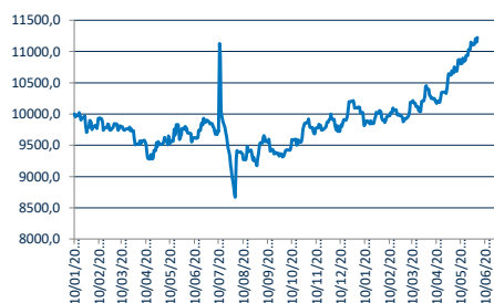
9.1 Evolución de 100.000 COP invertidos hace 5 años: