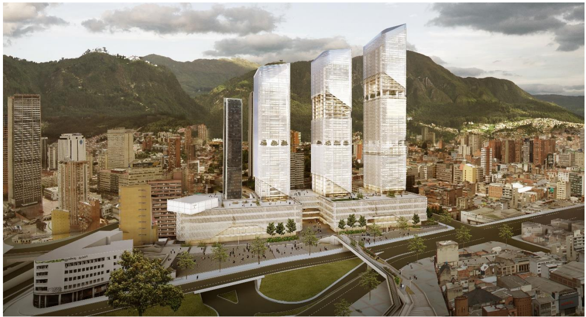
Imagen Aérea General del Sector 1

El diseño y construcción del Proyecto se conformará según la normatividad vigente para este tipo de construcciones y estructuras, denominado “ Categoría G: Proyectos de edificios mixtos ”, según el Decreto 2090 de 1989.