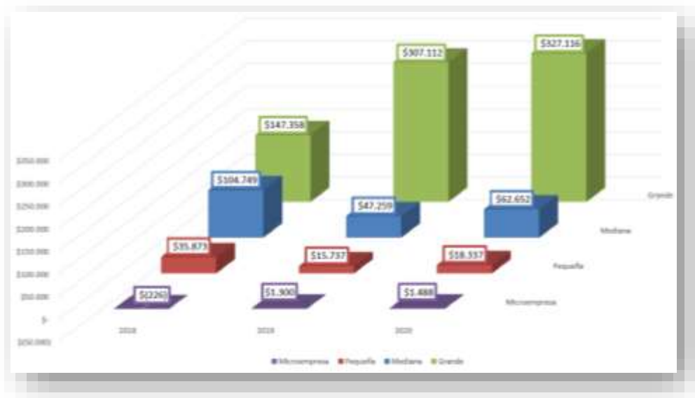
Gráfica N°3: Utilidad neta por tamaño de empresa 2018-2020

* Valores en millones / **El tamaño de empresa se ajusta de acuerdo con el Decreto N°957 del 05/06/2019 Fuente: www.supervigilancia.gov.co