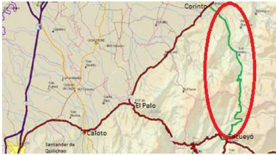
Esquema de localización del proyecto y áreas de estudio