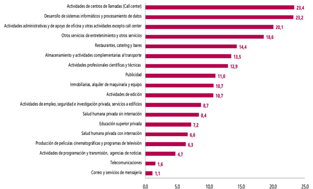
Gráfico No. 3 Variación anual de los ingresos nominales Según subsector de servicios Total nacional Diciembre 2022

Los anteriores servicios presentaron variación positiva en los salarios, en comparación con diciembre de 2019, los tres subsectores de servicios con variaciones de ingresos nominales altos, son las Actividades de centros de llamadas (Call center), el desarrollo de sistemas informáticos y procesamiento de datos y las actividades administrativas y de apoyo de oficina y otras actividades.