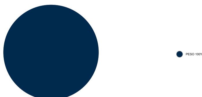
12.5 Composición portafolio por moneda