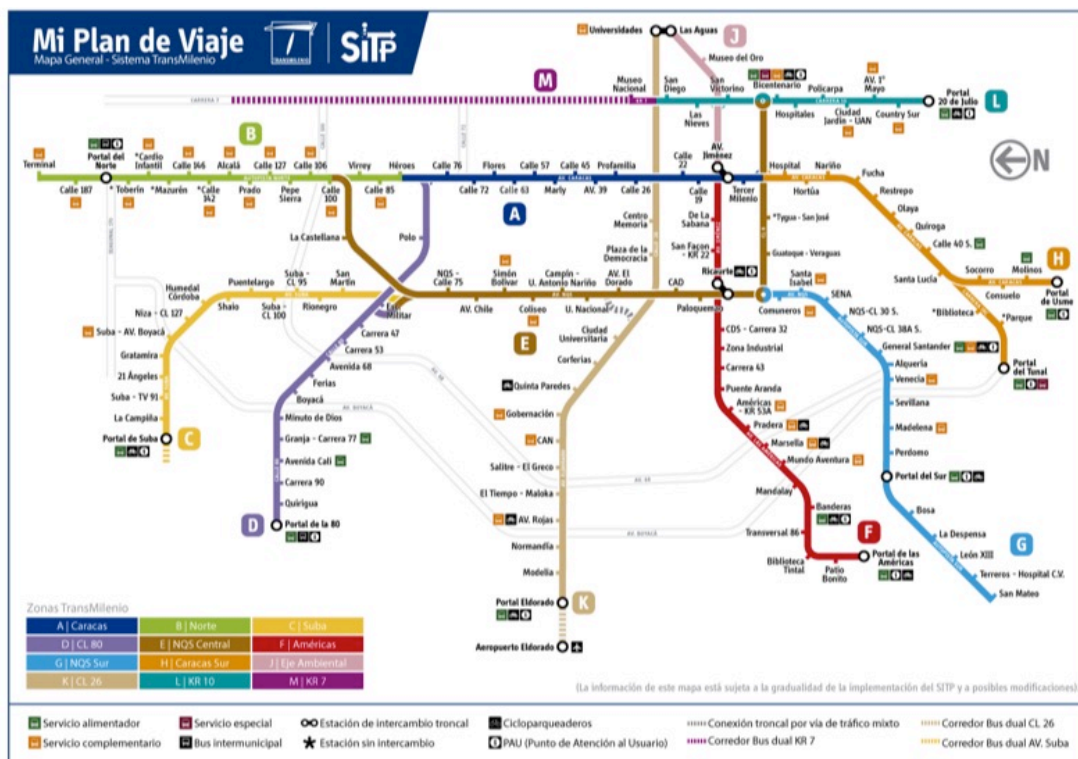
Ilustración 1 - Mapa del Sistema TransMilenio.